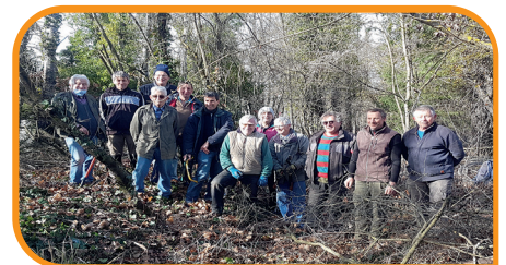
groupes de « débroussaillieurs »

Que les ordures doivent être déposées dans les poubelles à disposition. Que les animaux doivent être tenus en laisse, les sacs contenant leurs excréments dans les poubelles ad'hoc.