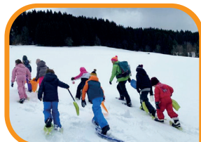
Journée à Autrans