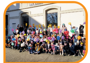
Pour terminer la semaine Winter party pour toutes et tous

Peyrimpimpin continue son p'tit bout de chemin grâce aux enfants, familles et élu.es.